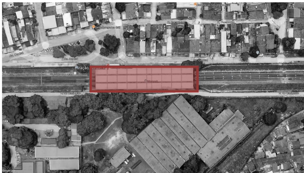
FIGURA 1 – ESTAÇÃO WERNECK